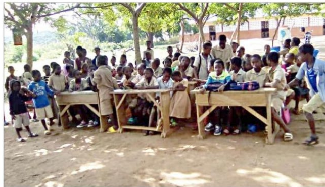
Les élèves d'Ounabè ont perçu de nouveaux bancs d'école. Leur bâtiment scolaire est au fond de la photo.

Créée en 2018 à Neufgrange, l'association La Cordée d'Ounabè, présidée par Yannick Kratz, tisse des liens étroits avec Ounabè, un village de brousse de 600 habitants au Togo. Les aides financières générées par ses 250 adhérents et ses animations portent leurs fruits.